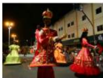
Maracatus desfilam tradicionalmente na Avenida Domingos Olímpio.

Treze grupos de maracatu desfilarão no domingo (19) na Avenida Domingos Olímpio. A programação começa às 16h30. O último maracatu está previsto para passar na avenida às 00h20.