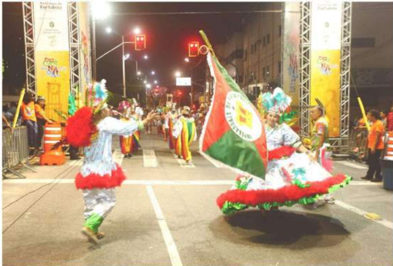
Escola de Samba Imperadores da Parquelândia Desfile Av. Domingos Olímpio - Carnaval 2016