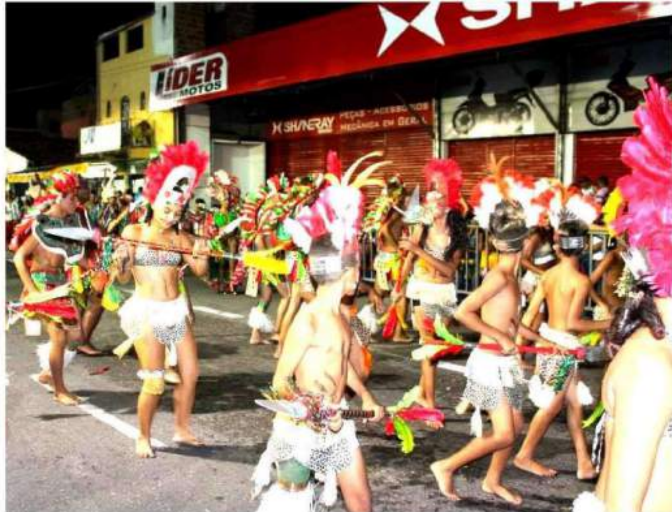
Escola de Samba Imperadores da Parquelândia Desfile Av. Domingos Olímpio - Carnaval 2015