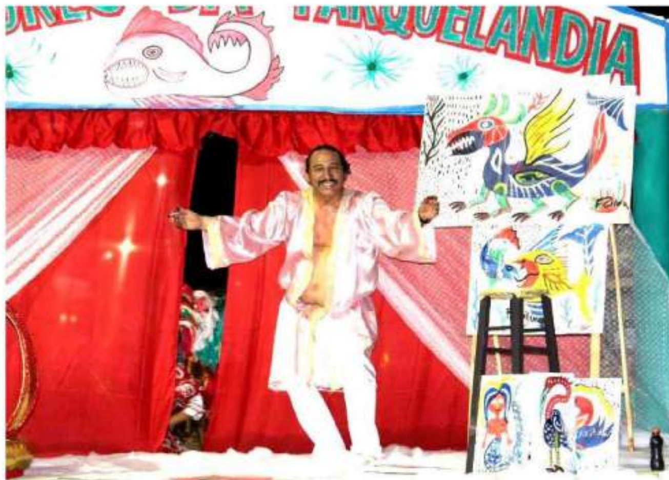
Escola de Samba Imperadores da Parquelândia Desfile Av. Domingos Olímpio - Carnaval 2015