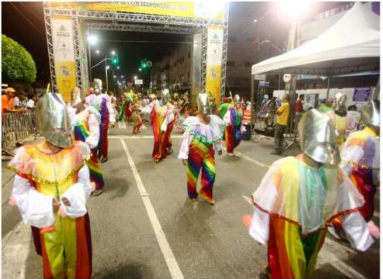
Escola de Samba Imperadores da Parquelândia Desfile Av. Domingos Olímpio - Carnaval 2016