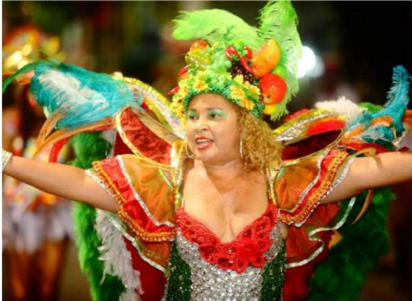
Escola de Samba Imperadores da Parquelândia Desfile Av. Domingos Olímpio - Carnaval 2016