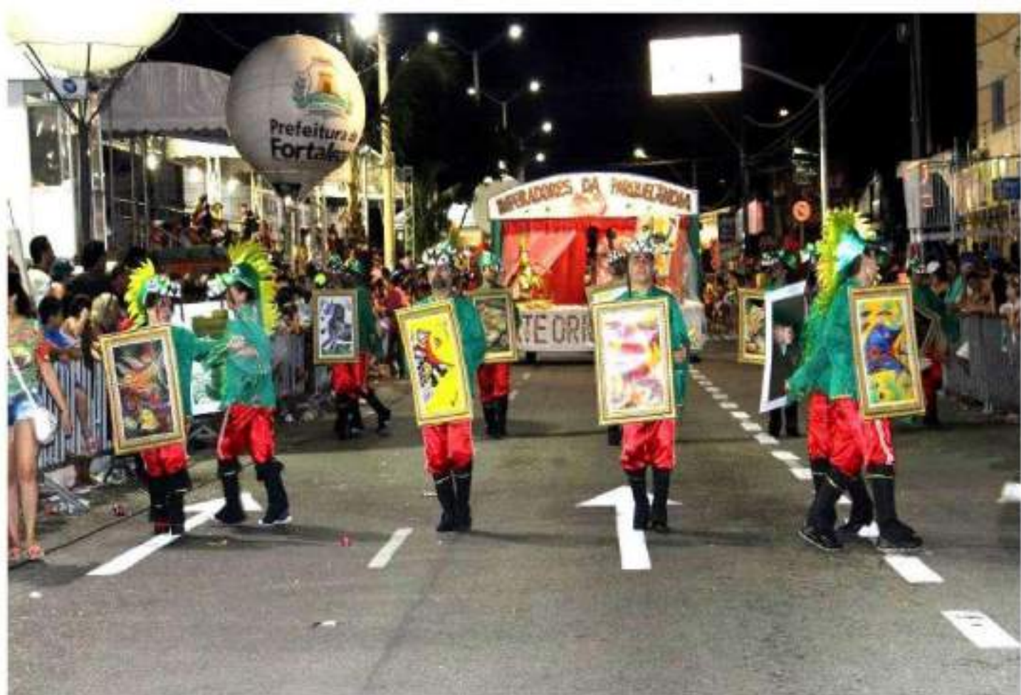
Escola de Samba Imperadores da Parquelândia Desfile Av. Domingos Olímpio - Carnaval 2015