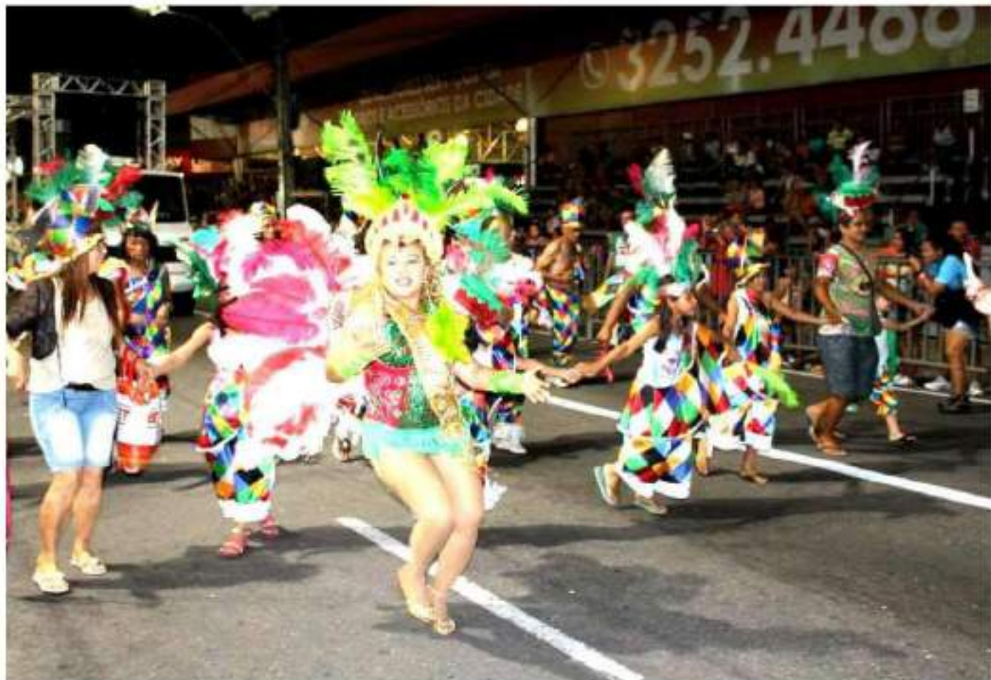
Escola de Samba Imperadores da Parquelândia Desfile Av. Domingos Olímpio - Carnaval 2015