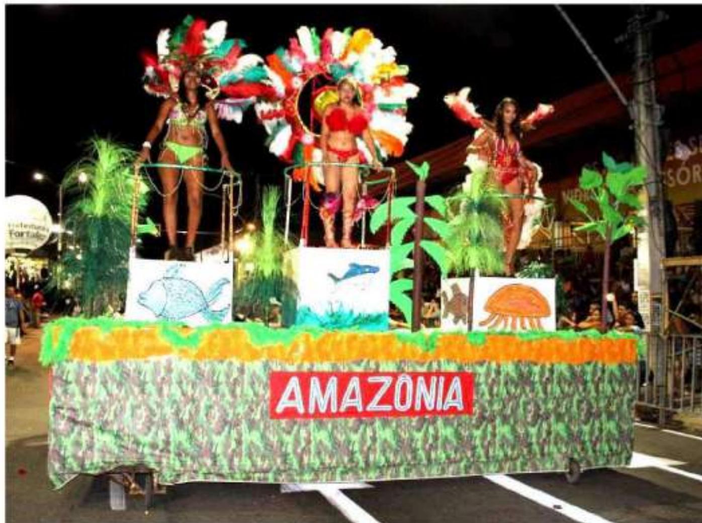
Escola de Samba Imperadores da Parquelândia Desfile Av. Domingos Olímpio - Carnaval 2015