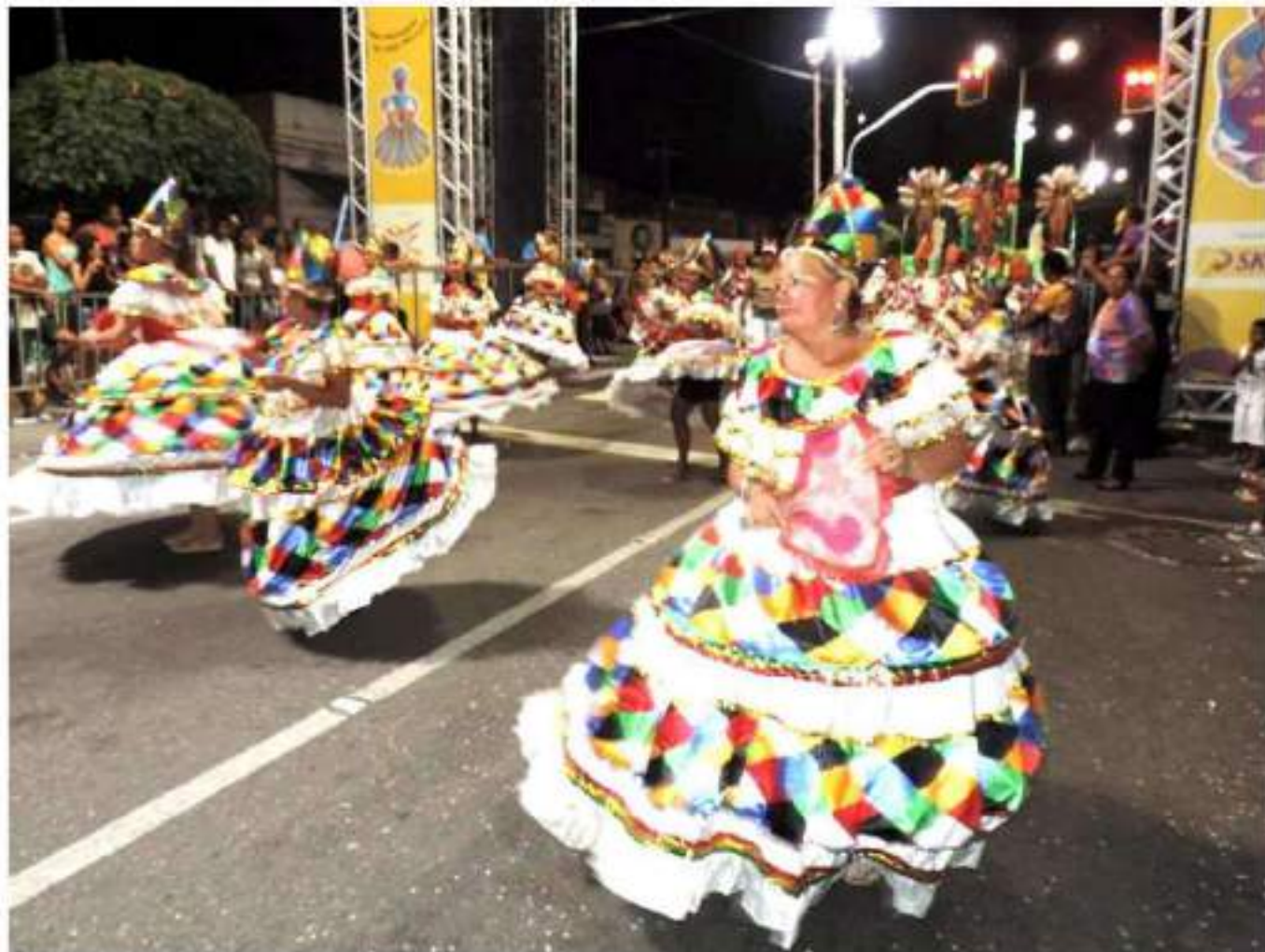
Escola de Samba Imperadores da Parquelândia Desfile Av. Domingos Olímpio