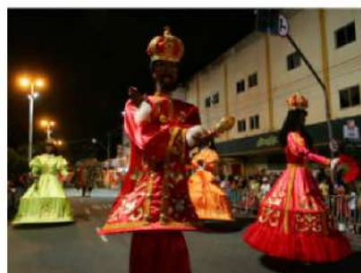
Maracatus desfilam tradicionalmente na Avenida Domingos Olímpio

Treze grupos de maracatu desfilarão no domingo (19) na Avenida Domingos Olímpio. A programação começa às 16h30. O último maracatu está previsto para passar na avenida às 00h20.