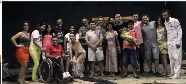
Produção: Espetáculo Ledores no breu (Cia do Tijolo)