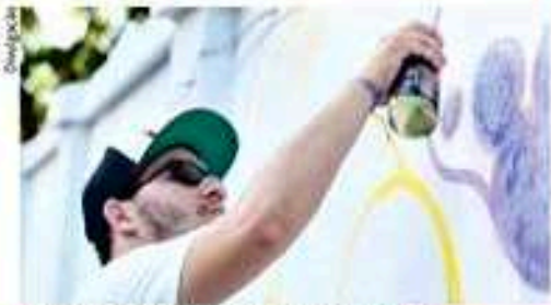
A exposição é de autoria do artista Carlos Diego

Com a circulação deste trabalho, o Coletivo tem a pretensão de alcançar espaços diversificados com o intuito e fomentar, promover e valorizar a arte de rua. "O lançamento da exposição será no