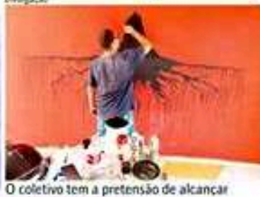
O coletivo tem a pretensão de alcançar espaços diversificados