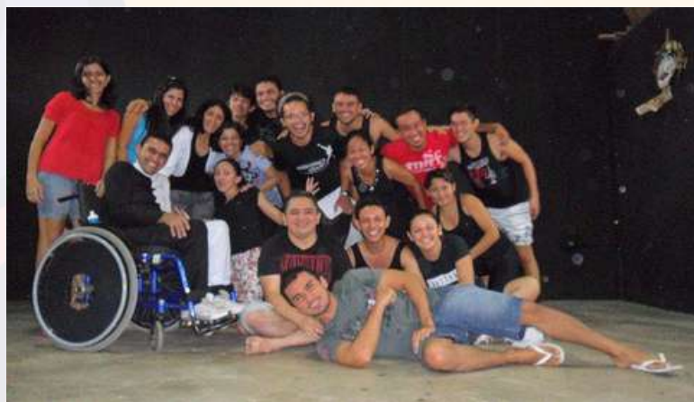
Projeto Olaria. Formação artística