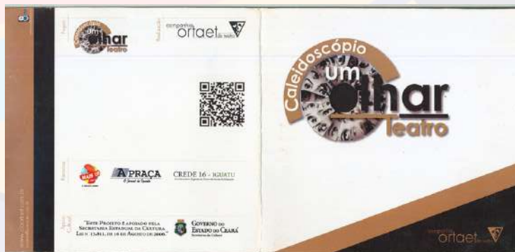
Projeto Caleidoscópio: Formação artística

PRODUÇÕES ENTRE 2010 E 2017 - IGUATU / CE