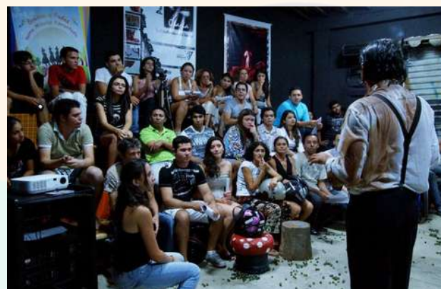
Formação de plateia Galpão de Artes