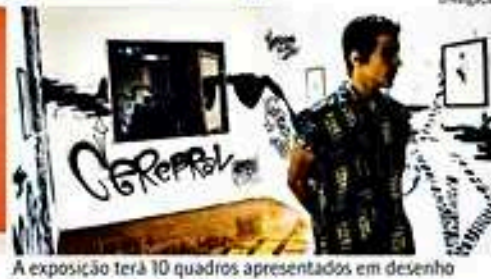
A exposição terá 10 quadros apresentados em desenho nanquim sobre papel creme