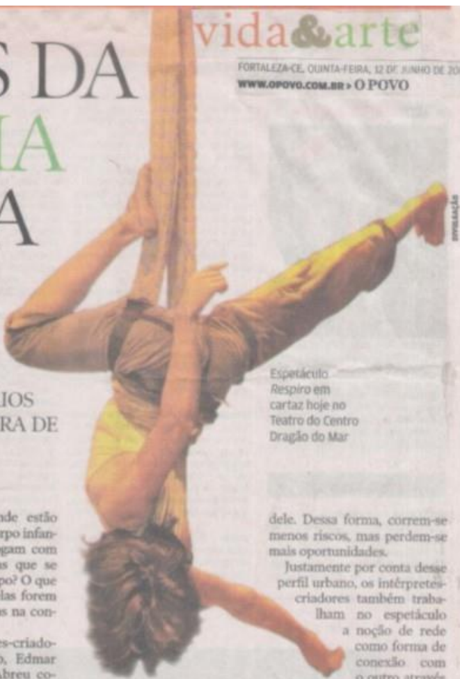
Espectáculo Respiro em cartaz hoje no Teatro do Centro Dragão do Mar