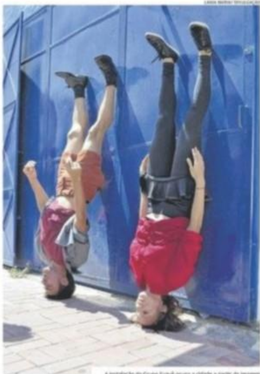
A instalação do Grupo Fuzuê ocupa a cidade a partir da imagem

Quando: hoje e na próxima quinta, a partir das 10h. Onde: ruas do Centro de Fortaleza (ruas no cruzamento da avenida Duque de Caxias e rua Barão do Rio Branco). Outras info: 3365 8996 / edmarcandido@gmail.com / fuzuegroup@gmail.com