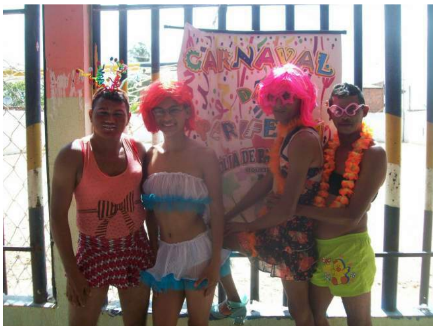
PROGRAMAÇÃO DO DIA 11 DE FEVEREIRO DE 2013 PARTIDA DE FUTEBOL DAS DONZELAS