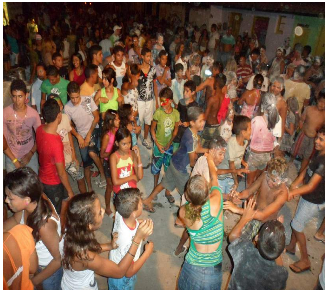
MELA MELA DO DIA 12 DE FEVEREIRO DE 2013