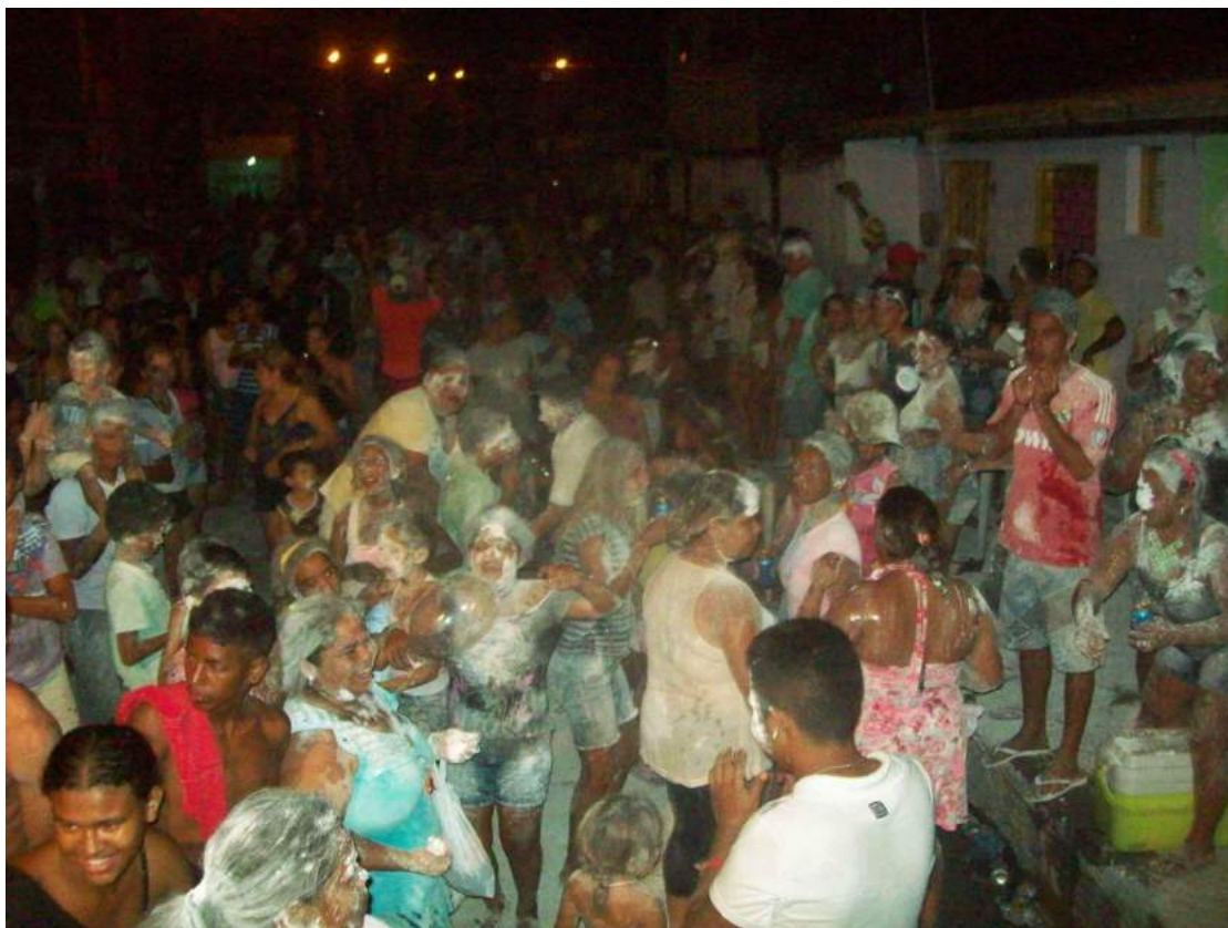
REGISTROS DO DIA 11 E 12 DE FEVEREIRO DE 2013

GRUPO DE DANÇA CONVIDADO AS ESTILOSAS DO SWING EM APRESENTAÇÃO NO DIA 11 DE FEVEREIRO DE 2013. BLOCO PRÉ CARNAVAL DA PERIFERIA