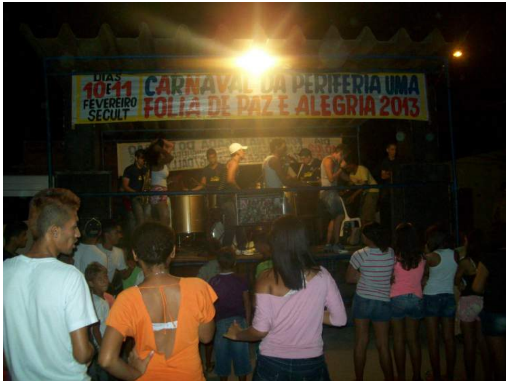
REGISTROS DO DIA 10 E 11 DE FEVEREIRO DE 2013.