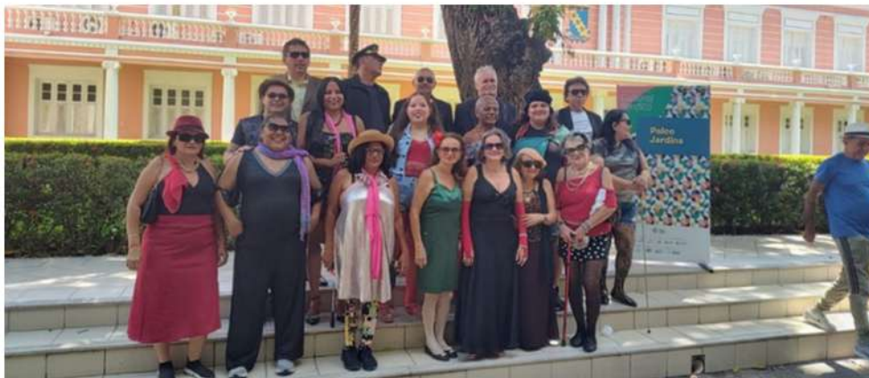
após apresentação do grupo de teatro Olho Mágico no Corredor Cultural Benfica/ Reitoria UFC. 16/12/23