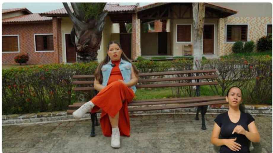
Além do Olhar: A Arte que Enxerga com a Alma - Episódio V