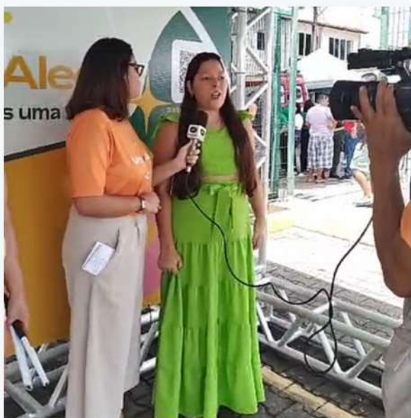
Entrevista com a TV Assembleia com o grupo Visão Musical após apresentação de canto na ALECE 03/05/24