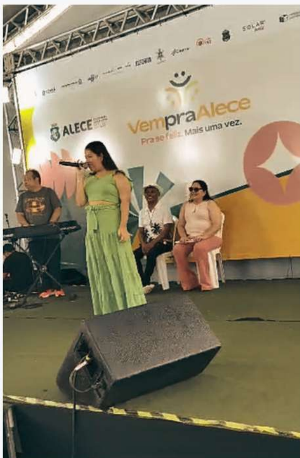
Apresentação de canto com o Visão Musical na ALECE 03/05/24