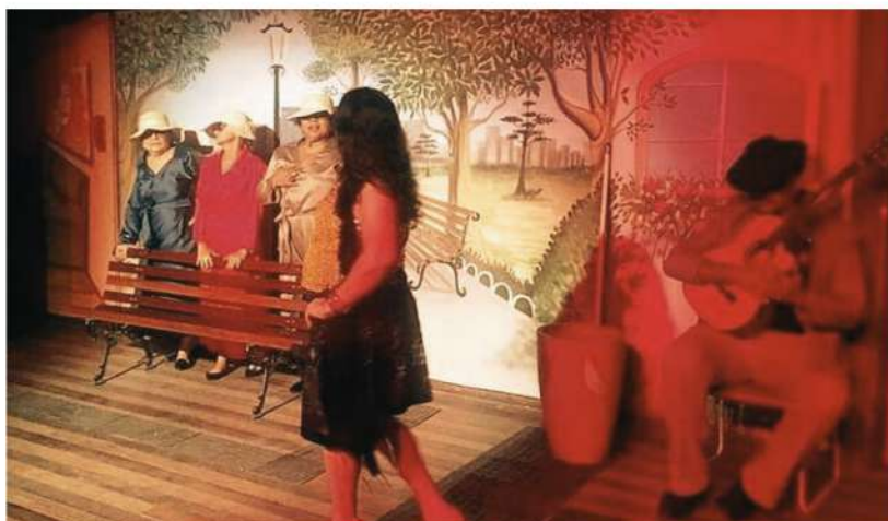
Peça "Vila Paradiso" - Cadastrado em 07/04/2022