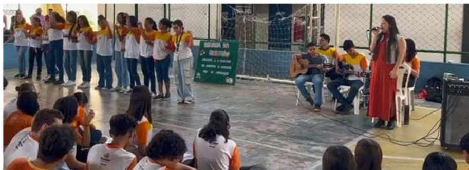
Apresentação de canto e palestra sobre inclusão, na escola EEFM Paróquia da Paz, localizada na Rua Visconde de Mauá, 905 A. Aldeota, Fortaleza