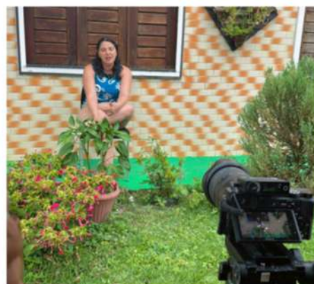
Gravações Web Série Além do Olhar: A Arte que Enxerga com a Alma". (2024)