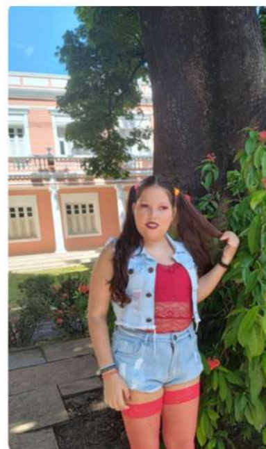
Corredor Cultural Benfica/Reitoria UFC para capa do mapa cultural 16/12/23