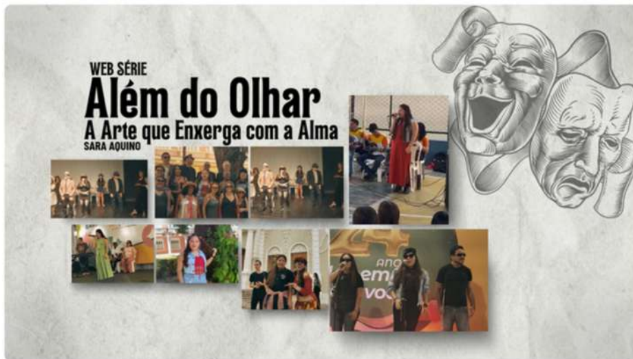
Além do Olhar: A Arte que Enxerga com a Alma - Episódio V

https://www.youtube.com/playlist?list=PLI2kOkMUh3hESakHzxKrMTOaYF1mGanvM