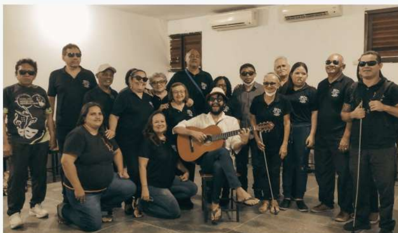
Apresentação de canto com o Visão Musical na ALECE 03/05/24