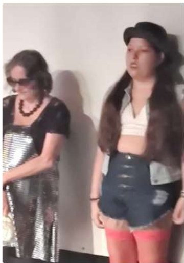
De trabalhadora do Bordel em a Opera do Malandro na Masteecclass do CCBJ 22/03/24