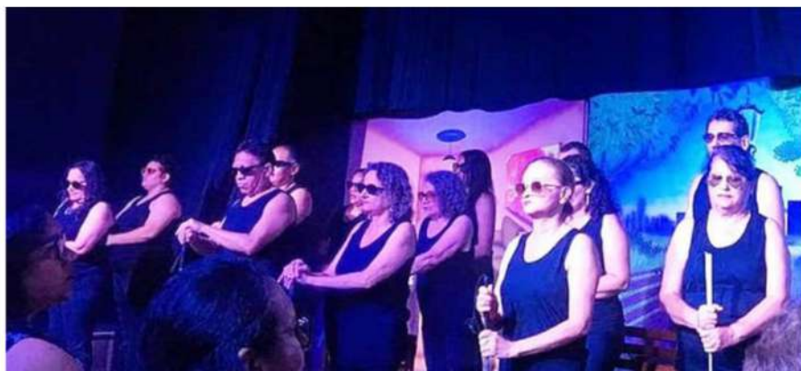
Performance - Cadastrado em 07/04/2022