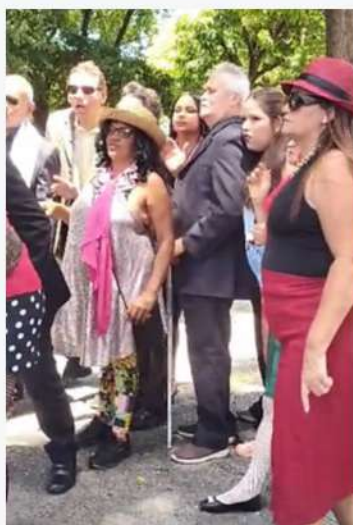
Apresentação do grupo de teatro Olho Mágico com a pernoface Geni e o Zé Pelim no Corredor Cultural Benfica/Reitoria UFC 16/12/23