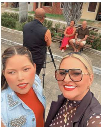
Gravações Web Série Além do Olhar: A Arte que Enxerga com a Alma". (2024)