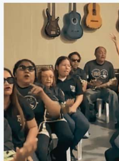
Chamada para a apresentação do espetáculo De Algum Lugar Para Lugar Nenhum no Corredor Cultural Benfica/Reitoria UFC 02/12/23