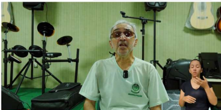
Além do Olhar: A Arte que Enxerga com a Alma - Episódio IV