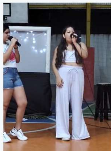
Cantando Meu Abrigo no Festival de Natal do Camurupim 03/12/23