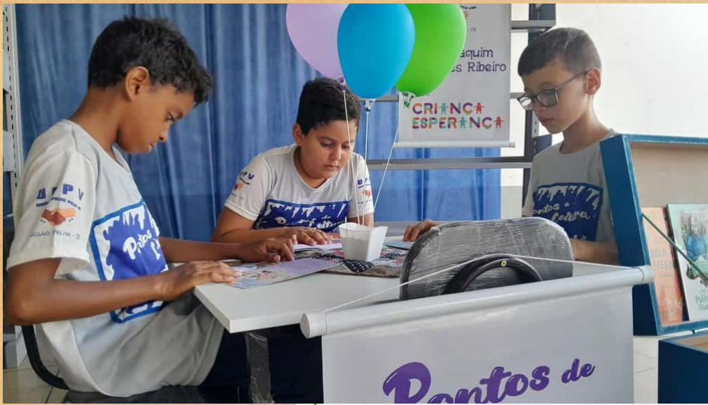
EQUIPE DE CRIANÇAS REPRESENTANDO AS ESCOLAS MUNICIPAIS