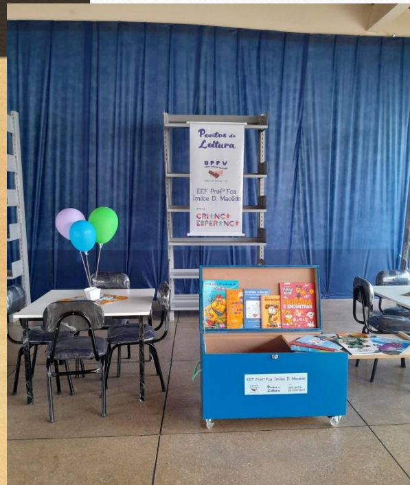
KITs PONTOS DE LEITURA