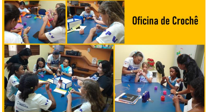
Oficina de Crochê