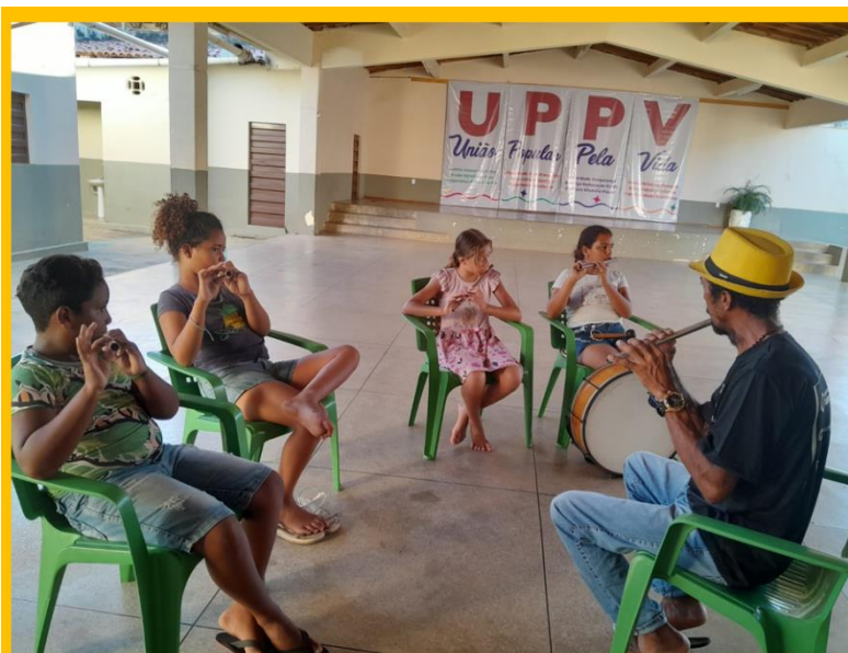
Oficina de Música: Pífano