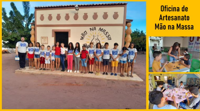
Oficina de Artesanato Mão na Massa