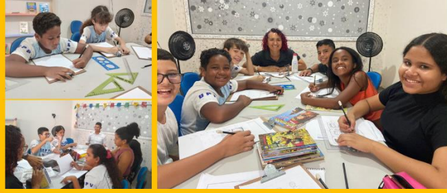
Artes Visuais - Desenho